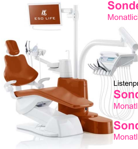
KaVo E50 Life