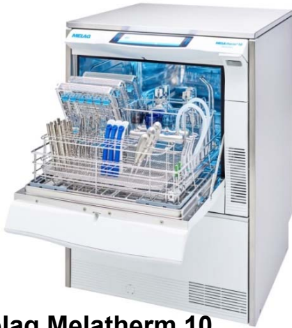
Melag Melatherm 10 Evolution mit Zubehörpaket Listenpreis: 11.648,00 Sonderpreis 9.920,00 Monatliche Leasingrate 144,00