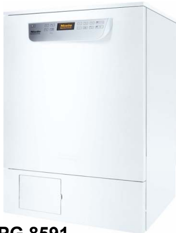
Miele PG 8591 mit Zubehörpaket Listenpreis: 12.429,00 Sonderpreis 10.689,00 Monatliche Leasingrate 156,00

Listenpreis: 9.140,00 Sonderpreis 6.220,00 Monatliche Leasingrate 91,00