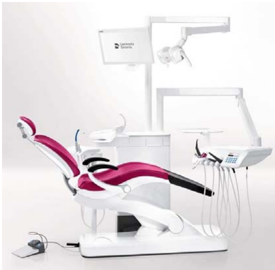
Sirona Intego Pro