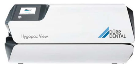
Dürr Hygopac View

Listenpreis: 1.400,00 Sonderpreis 1.148,00 Monatliche Leasingrate 17,00