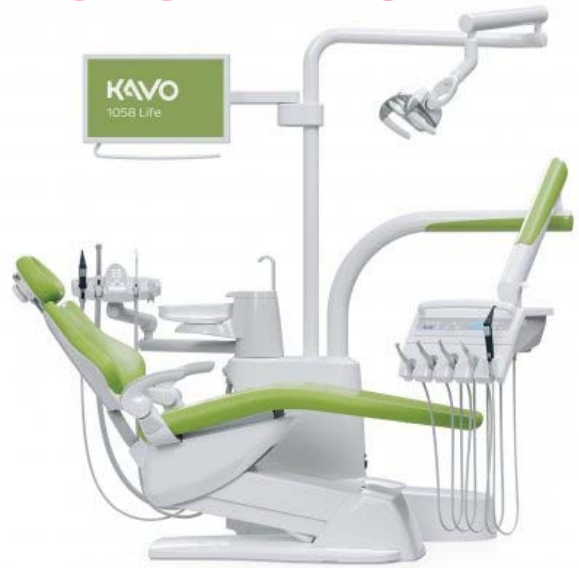
KaVo Primus 1058 Life TM