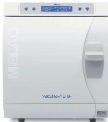
Melag Vacuklav 31B Plus mit Zubehörpaket

Listenpreis: 9.140,00 Sonderpreis 6.220,00 Monatliche Leasingrate 91,00