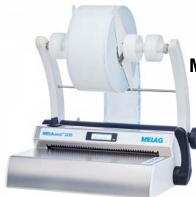
Melag Melaseal 200

Listenpreis: 1.400,00 Sonderpreis 1.148,00 Monatliche Leasingrate 17,00