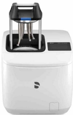
Sirona DAC Universal Touch mit Zubehörpaket Listenpreis: 8.500,00 Sonderpreis 6.408,00 Monatliche Leasingrate 93,00