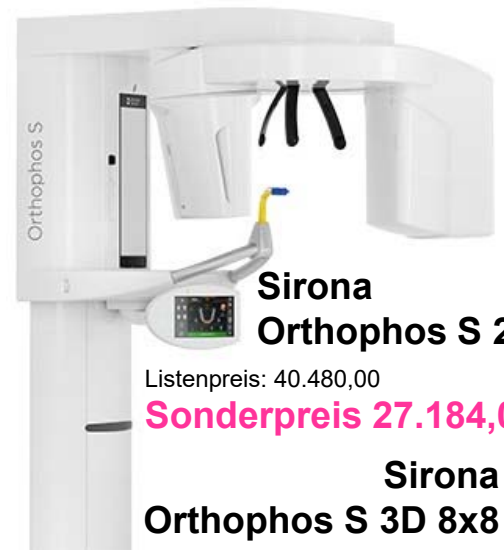
Sirona Orthophos S 2D