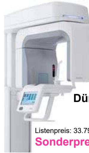
Dürr Vista Pano S 2D