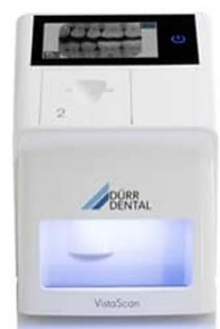
Dürr Vista Scan Mini View 2.0