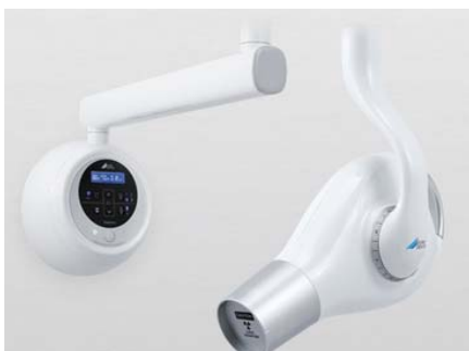
Dürr Vista Intra DC