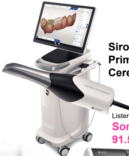
Sirona Cerec Primescan AC + Cerec Primemill