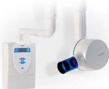
Sirona Heliodent Plus