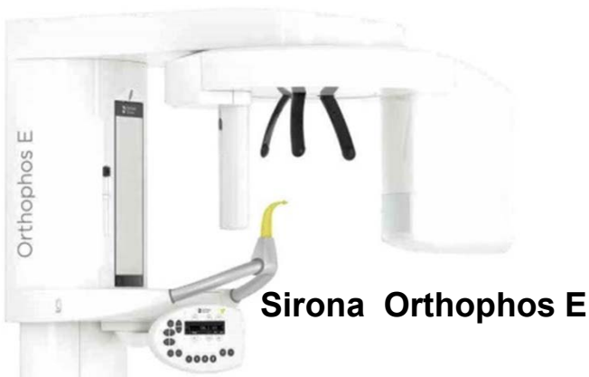
Sirona Orthophos E